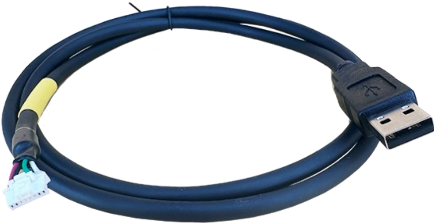
图 3 USB 转 Molex A（501330-0800）线束

注 2：此线束适用于 EVAL HI02XX 产品，线长 1 m，内置 USB 转 UART（TTL 电平）转换模块